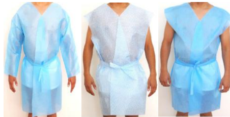
BATA PARA PACIENTE CON MANGA LARGA: AZUL BATA PARA PACIENTE SIN MANGA GRANDE: AZUL RAYADA BATA PARA PACIENTE SIN MANGA: AZUL o BLANCA