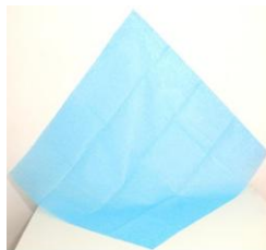
CAMPO CLINICO 90x90cm: AZUL o BLANCO