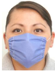
CUBREBOCA DESECHABLE AZUL o BLANCO