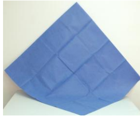
CAMPO CLINICO DE 90x90cms