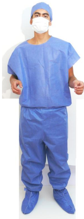
EQUIPO PARA CIRUJANO

CONTIENE: GORRO, MASCARILLA, CAMISA, PANTALON Y BOTAS SIN PLANTILLA