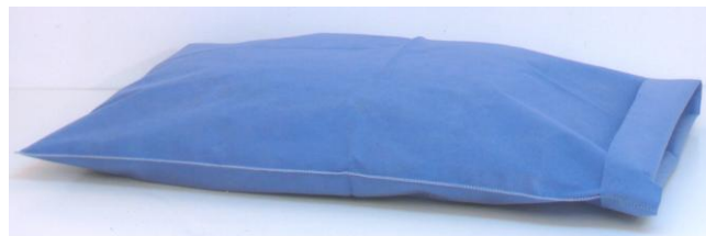
FUNDA PARA ALMOHADA