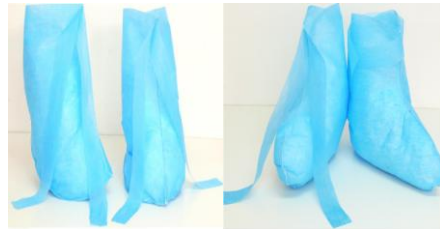
BOTA CON PLANTILLA: AZUL BOTA SIN PLANTILLA: AZUL